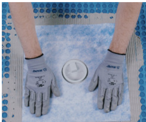
Lefolyók vízszigetelése Drain Vertical/Drain Lateral-lal