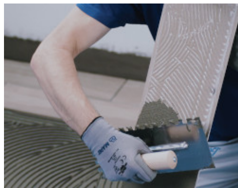
Kerámia vagy kő burkolat fektetése a megfelelő, legalább C2-es MAPEI ragasztóval