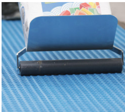
Mapeguard UM 35 lehengerezése