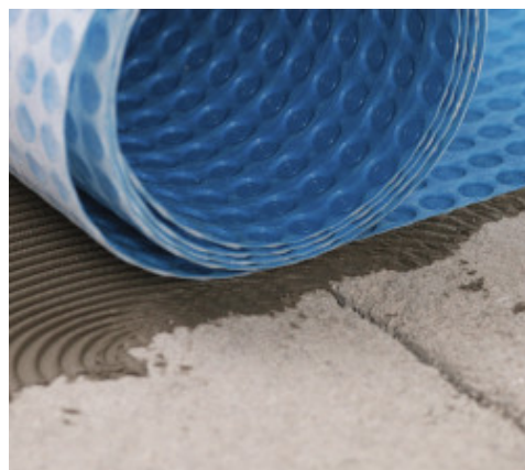
A Mapeguard UM 35 fektetése