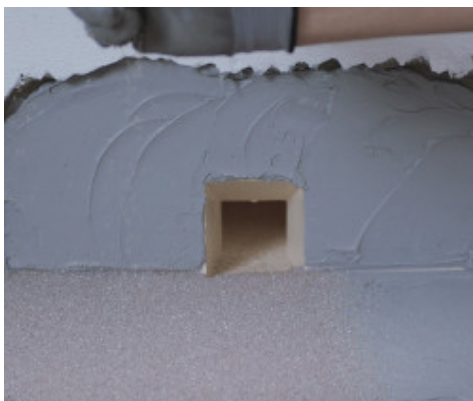
Csatorna vízszigetelése Drain Front-tal