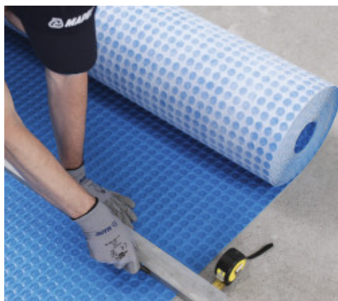
A Mapeguard UM 35 vágása

A Mapeguard UM 35 lemez helyes fektetéséhez olvassa el a Fektetési útmutatót, amely elérhető a www.mapei.com honlapon vagy lépjen kapcsolatba a MAPEI Műszaki ügyfélszolgálatával.