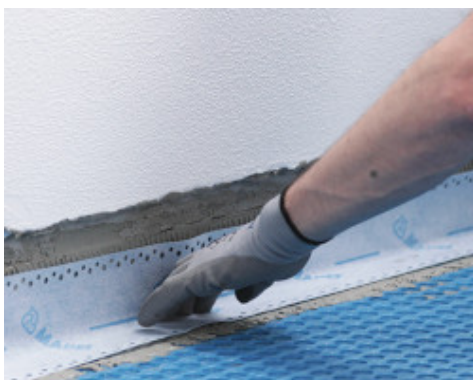
A szélek vízszigetelése Mapeband Easy-vel, Mapeguard WP ragasztóval ragasztva