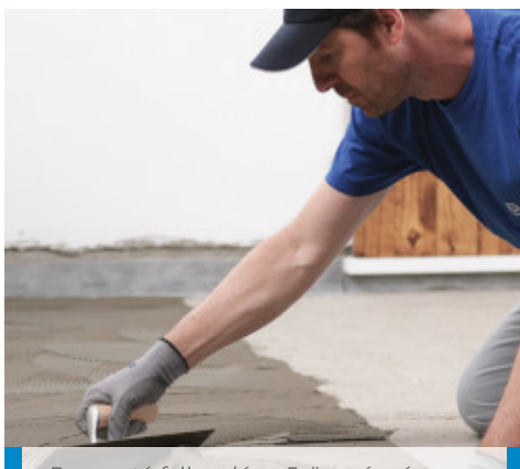
Ragasztó felhordása 5-ös számú fogazott simítóval