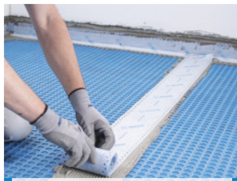
Lemezek közötti csatlakozások vízszigetelése Mapeband Easy-vel, Mapeguard WP ragasztóval ragasztva